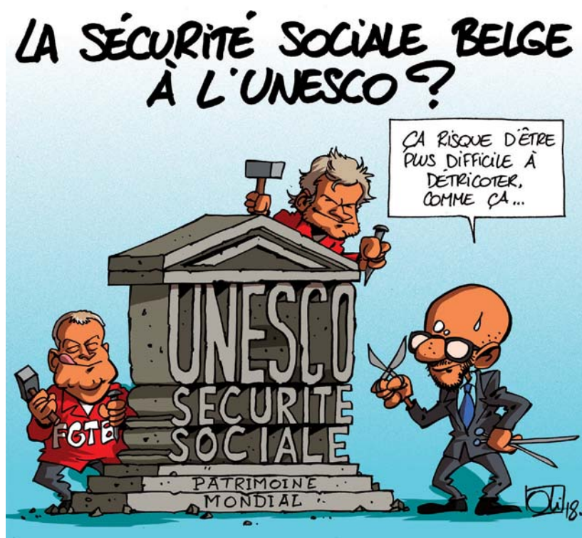
« La sécurité sociale belge à l'UNESCO », Les humeurs d'Oli (2018) © Oli - Sudpresse - 22/08/2018